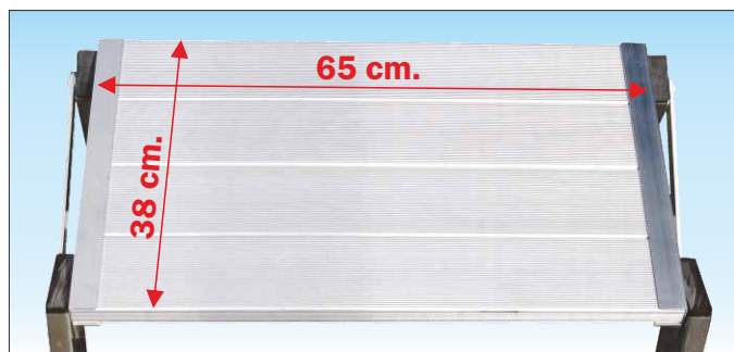
Piattaforma maggiorata in robusto profilato d'alluminio dimensioni 380 x 650 mm.