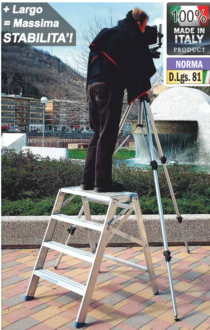
In foto articolo SCA 6029/04

ASSICURAZIONE PRODOTTO Danni a cose e persone 3.000.000