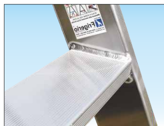
Gradino profondo 95 mm. saldato al montante con superficie anti-scivolo