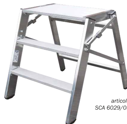
articolo SCA 6029/03