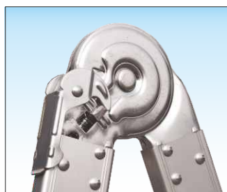
Cerniera anti-urto in acciaio