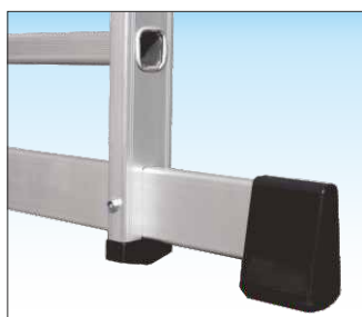
Basetta stabilizzatrice smontabile