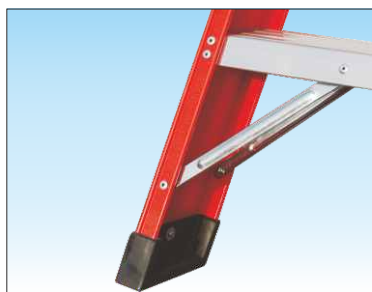
Base rinforzata con nervature anti-urto e piedino anti-scivolo