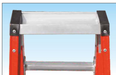
Robusta vaschetta porta-oggetti in alluminio dimensioni cm. 9 x 30 e profonda 4 cm.