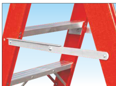
Barre distanziatrici di sicurezza anti-chiusura e anti-divaricamento ad apertura automatica in alluminio anti-ruggine